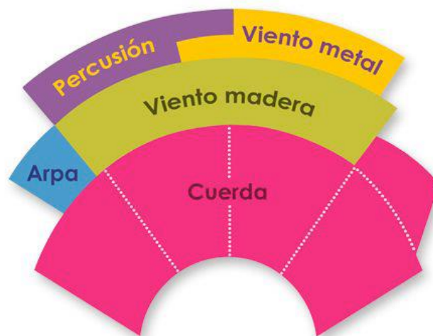
Disposición de la orquesta